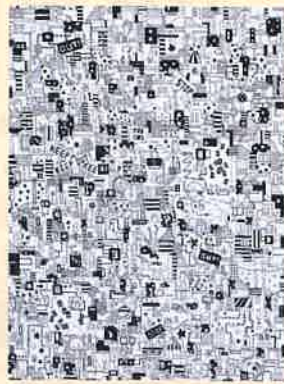
「星が好きな少年」みすてら