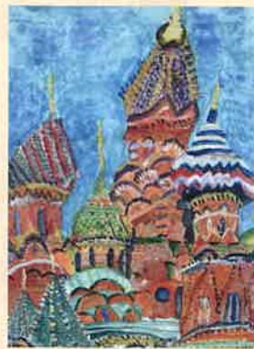
「ヴァシーリー聖堂(ロシア)」森田 慧