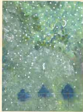
「雪 こんこん」新 三千代