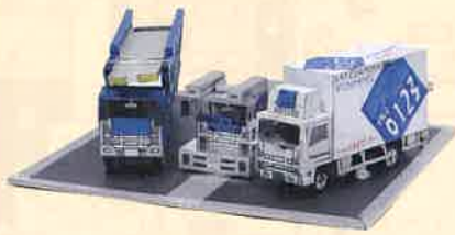
「3台のトラック」松海 英知